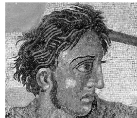
Alexandre se encontra com Dario III, mosaico.

O Mosaico foi muito utilizado na decoração dos muros e pisos da arquitetura em geral, de que cultura: