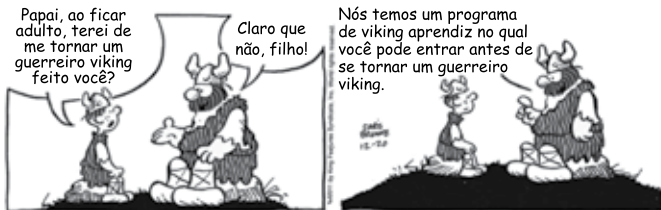
(Dik Browne, Folha de S.Paulo , 13.01.2013)

13. Leia a tira de Hagar, por Dik Browne.