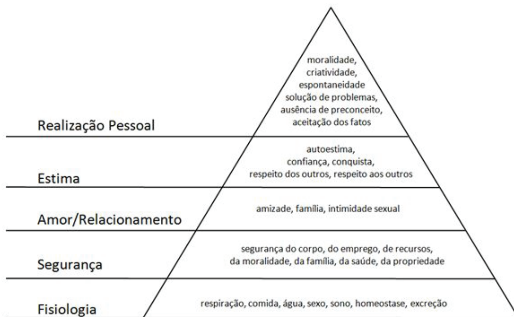
Imagem ampliada da questão 48 da página 12: