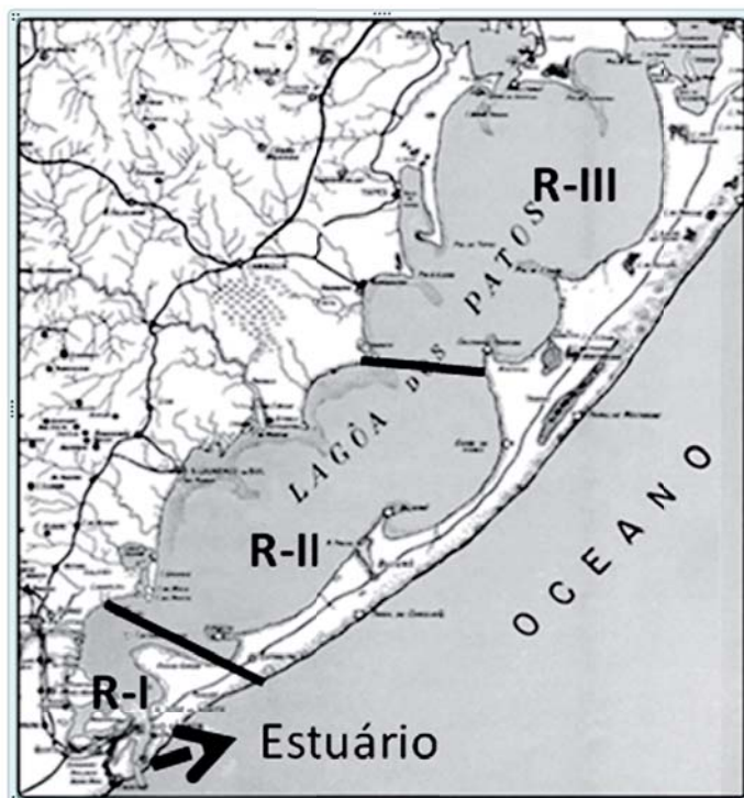
Mapa de localização das áreas amostradas (R-I, R-II e R-III) na Lagoa dos Patos (RS).

VIEIRA, J.P.; GARCIA, A.; MOARES, L. A assembleia de peixes. In: O Estuário da Lagoa dos Patos: um século de transformações . SEELIGER, U.; ODEBRECHT, C. Fundação Universidade de Rio Grande (FURG), 2010.