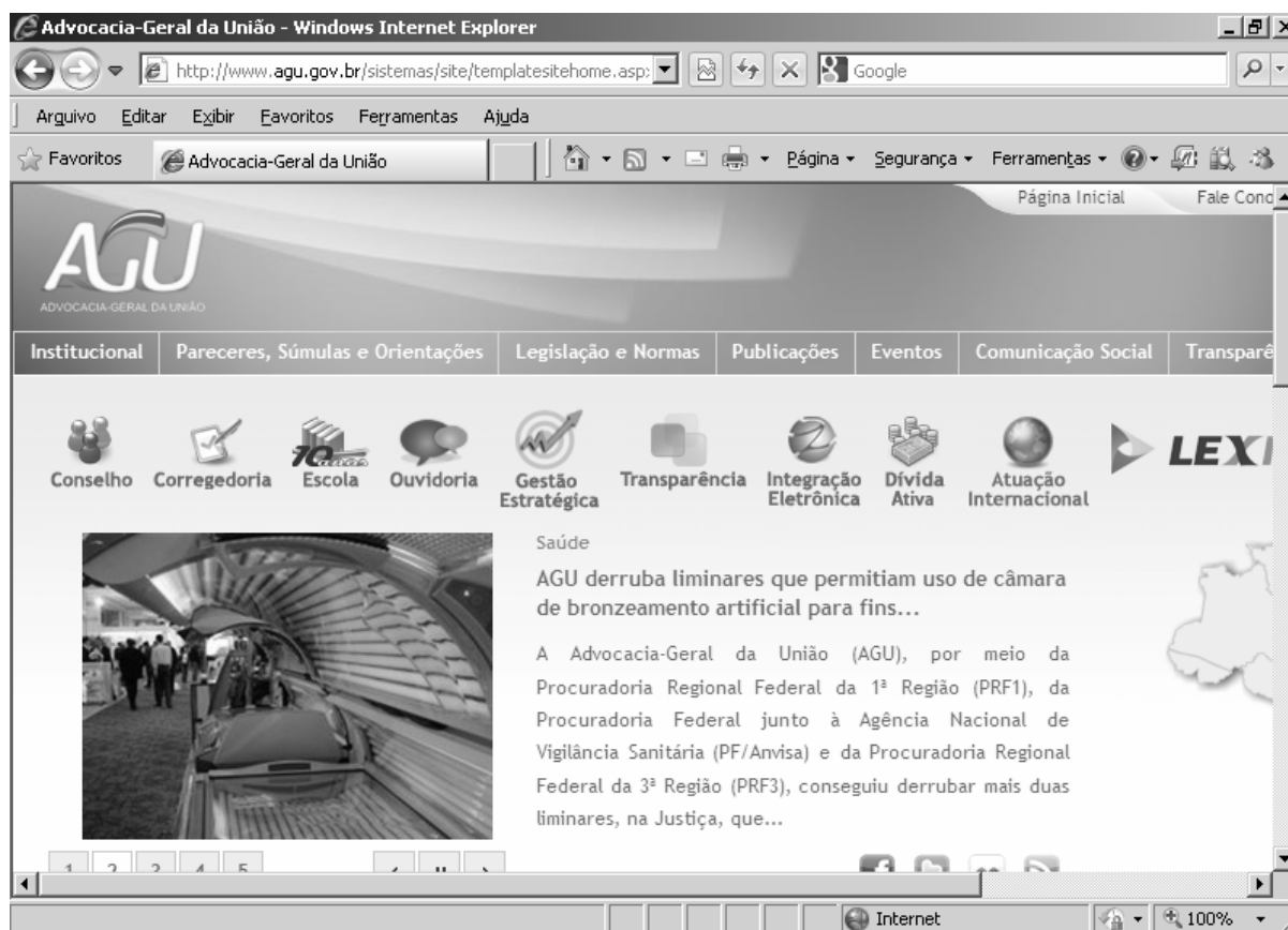
Figura para os itens de 33 a 38

A figura acima apresenta uma página acessada utilizando-se o Internet Explorer 8 (IE8).