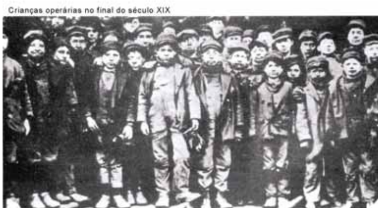
(PAZZINATO, A. L., SENISE, M. H. V. História Moderna e Contemporânea . São Paulo: Ática, 1994. p. 177.)

Com base na imagem, considere as afirmativas a seguir.