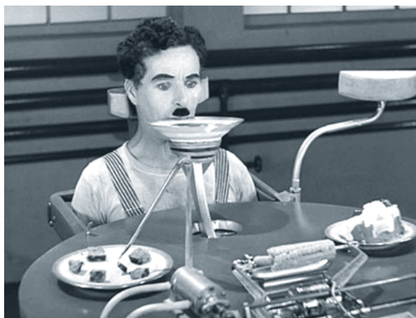
Cena do filme Tempos Modernos