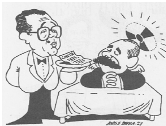
BRAGA, J. Retrato falido. Goiânia, O Popular , 1994, p. 27.

Charges e caricaturas são fontes preciosas para o estudo do passado. Na ilustração ao lado, o cartunista Jorge Braga ironiza um evento ocorrido no estado de Goiás e o ambiente político que o envolvia. Identifique esse evento e as circunstâncias de sua ocorrência.