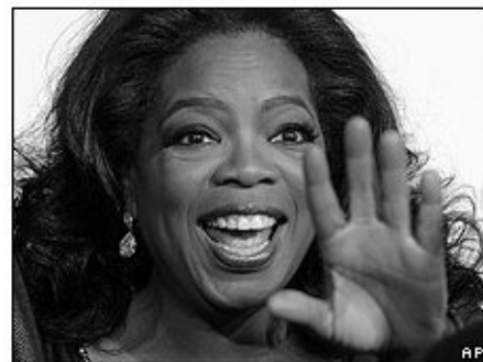
Oprah Winfrey vuelve a ser la famosa que más gana en 2009 al desbancar a Angelina Jolie.