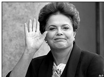
Según dos encuestas, la candidata tendría el apoyo del 40% del electorado.

1 Un cambio de dirección. En 2 los últimos días dos 3 sondeos publicados en 4 Brasil confirman una nueva 5 tendencia en la carrera 6 presidencial para los 7 comicios de octubre 8 próximo. Por primera vez, la 9 candidata oficial, Dilma 10 Rousseff, lleva la delantera.