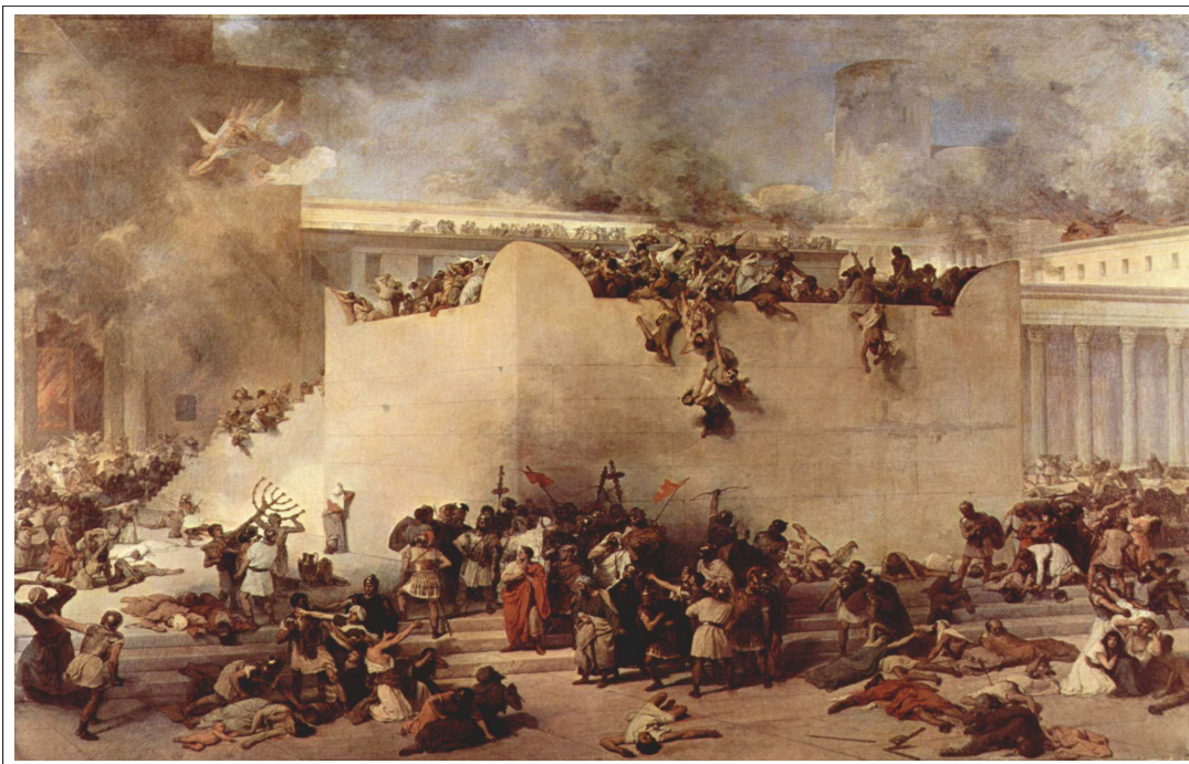
HAYEZ, Francesco. "Destruição do Templo de Jerusalém". Disponível em: < www.paroquia-smbelem.pt/imagens/destruicao_templo_jerusalem.jpg >. Acesso em: 4 mai. 2009.

Produzido em 1867, o quadro remete a um acontecimento importante para a religião judaica. Com base na análise histórica dessa religião,