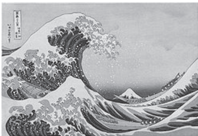
Xilogravura "A Grande Onda de Kanagawa", de Katsushika Hokusai (1760-1849),