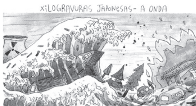
Charge de João Montanaro, publicada na Folha de S.Paulo, 12/03/2011, um dia depois da tragédia que assolou o Japão.