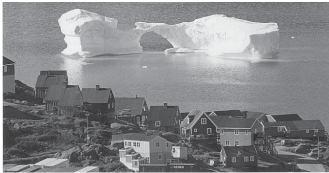
O mundo em 2010. The Economist . nº 577-4, p.83, jan./fev. 2010.

Os groenlandeses estão assumindo mais poderes de autogoverno, depois que os dinamarqueses cederam parte do seu controle em 2009. De 2010 em diante, o governo dessa ilha coberta de gelo vai assumir o controle dos assuntos domésticos. Quando o gelo da Groenlândia encolher, novas atividades econômicas florescerão. Uma das expectativas é a descoberta dos longamente prometidos depósitos de petróleo e gás no leito oceânico. Estima-se a existência de bilhões de barris de petróleo e trilhões de metros cúbicos de gás. Descobrir e explorar um grande depósito de petróleo e gás na ilha iria alegrar os groenlandeses e seria útil para a geopolítica europeia.”