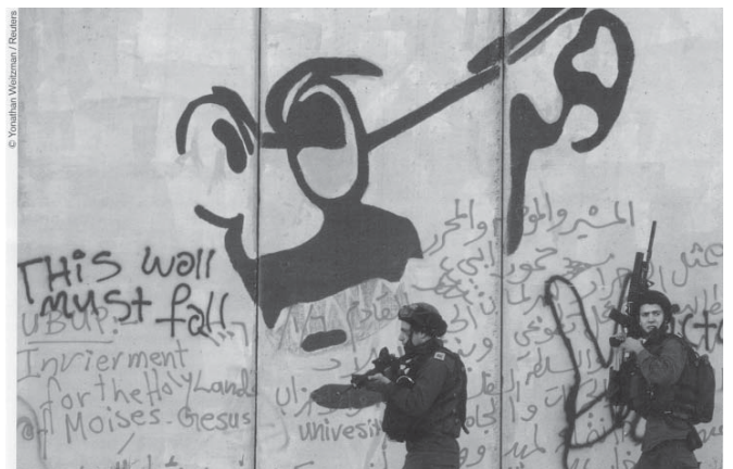
O muro construído por Israel na Cisjordânia