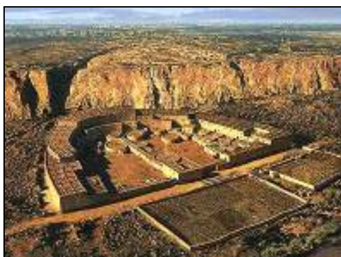
Chefia ou Cacicado (Chaco Canyon, EUA)