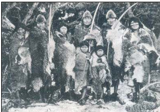
Bandos (Onas, Terra do Fogo)

Questão 8: As imagens abaixo ilustram as quatro formas de organização social encontradas na América, quando da chegada dos europeus ao final do século XV.