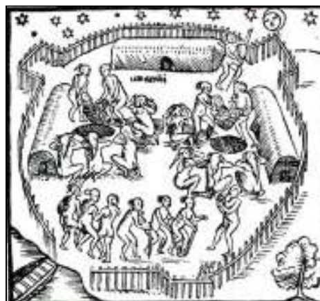
Tribos (Aldeia tupiniquim, Brasil)