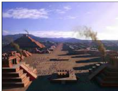
Estado (Teotihuacan, México)

As antigas populações brasileiras se organizavam, principalmente, como bandos e tribos. Caracterize o modo de vida dessas populações.