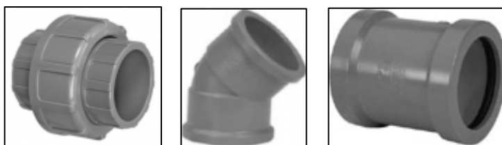
(A) (B) (C)

Os componentes tipo soldável abaixo, utilizados nas instalações hidráulicas de bebedouros de água gelada indicados pelas letras A, B e C são respectivamente :