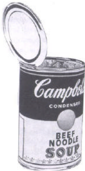
Lata da sopa Campbell de 19 centavos ( 1960 ).