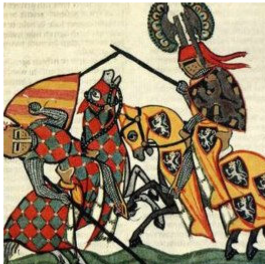
“Medieval Sports” “Esportes medievais” .

site: http://www.middle-ages.org.uk/medieval-sports.htm acessado em 02/11/2009)