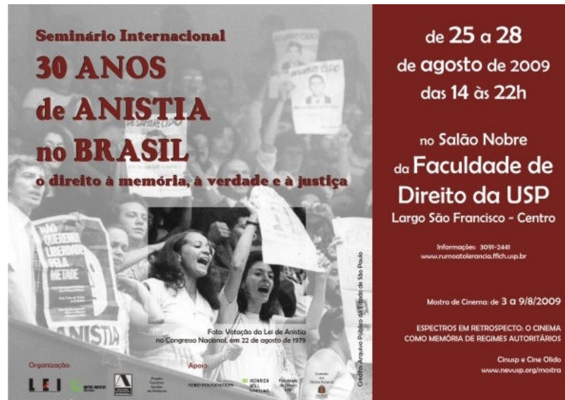
Cartaz das comemorações pelos 30 anos da lei da anistia, www.rumootolerancia.fflch.usp.br/.../15?page=12 acessado em 02/11/2009

A imagem acima é um cartaz que anuncia as comemorações dos 30 anos da lei da anistia no Brasil. Esta lei foi sancionada em um momento muito conturbado da história do Brasil e significou