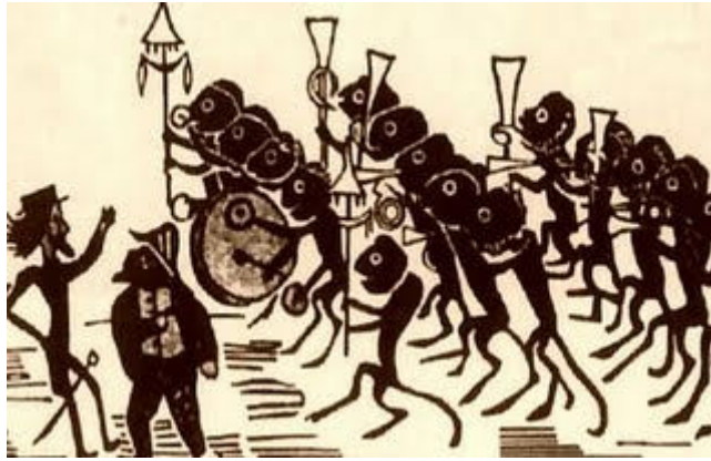
Conde D'Eu e Caxias inspecionam a tropa brasileira – 1869 – jornal paraguaio.

A imagem acima é uma charge de um jornal paraguaio sobre as tropas brasileiras comandadas por Caxias e pelo Conde D'Eu durante a Guerra. Dela e de seus conhecimentos sobre a Guerra do Paraguai, é correto afirmar que os paraguaios representavam as tropas e lideranças brasileiras