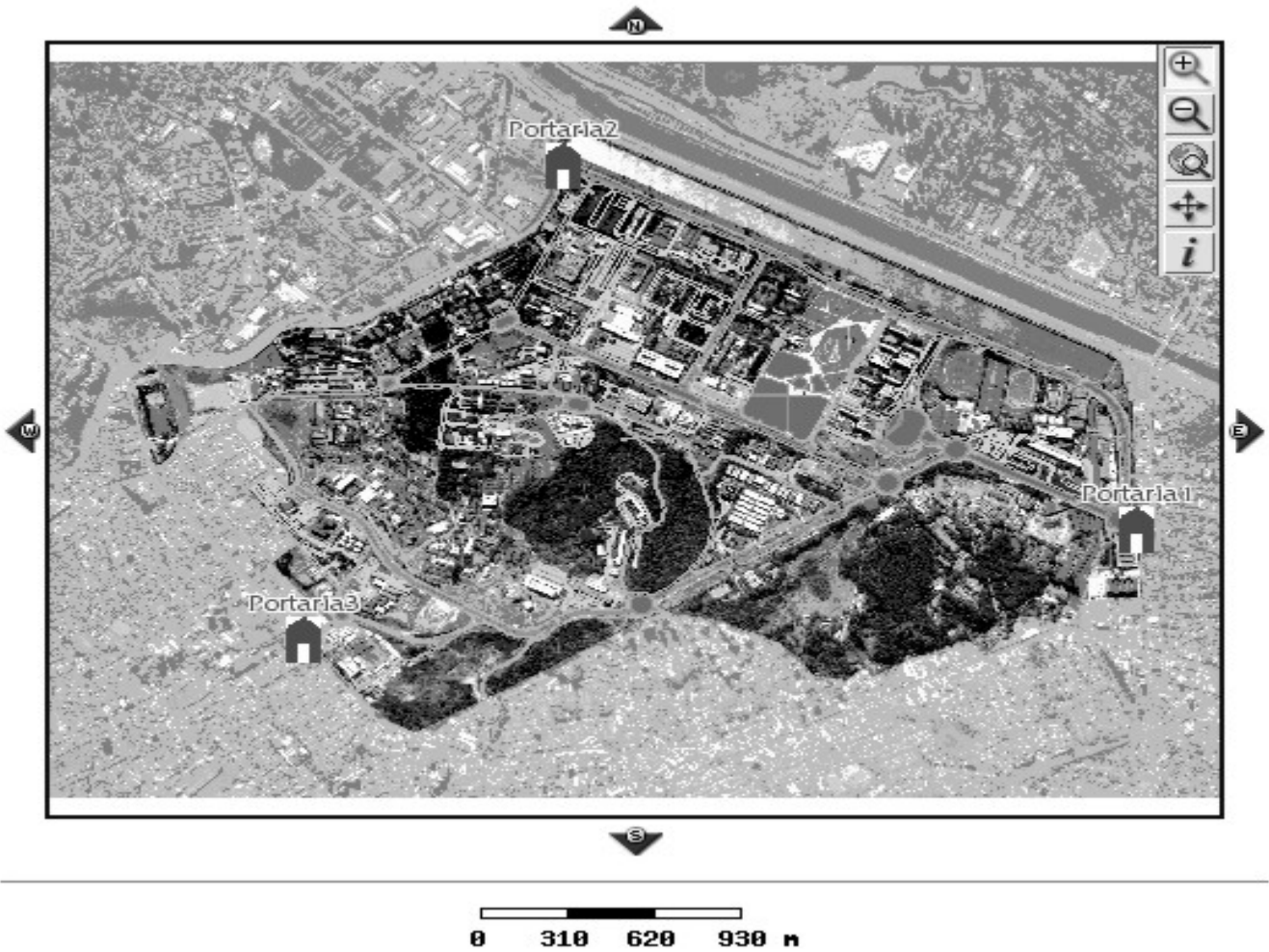
Ilustração 2 USP. Cidade Universitária, São Paulo-SP. Ortophoto com esquema de urbanização. Fonte: < http://143.107.240.111/maplab_projects/gmf_apps/usp/usp.phtml >. Acesso em: 20 jul. 2009.