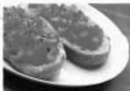
2 bruschettas (pão italiano, tomate, azeite, orégano e alho) 130 cal