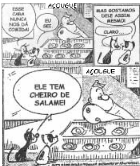
Patric MacDonnel. In: Correio Braziliense , 20/2/2004 (com adaptações).

Observando a ilustração acima, julgue os itens que se seguem.