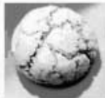
1 minibiscoito de amaretto 53 cal