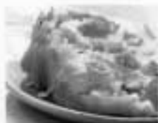
1 fatia de pão de calabresa (130 g) 479 cal