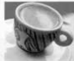
1 xícara pequena de capuccino 44 cal

A figura acima mostra a quantidade de calorias de alguns alimentos e bebidas. Julgue os itens seguintes acerca dessas informações.