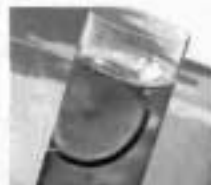
1 copo de guaraná diet (300 ml) com laranja 2 cal