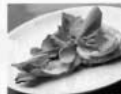
1 fatia de pizza de mussarela de búfala e rúcula 280 cal