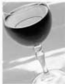
1 taça de vinho tinto (180 ml) 129 cal