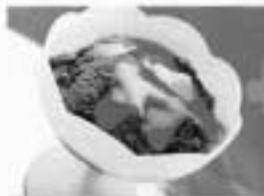
1 bola de sorvete de chocolate (40 g) e 1 col. (sopa) de calda 99 cal